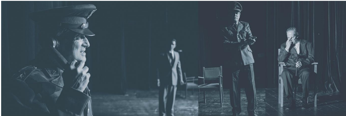
Blizny pamięci..., zdjęcie z próby, Warszawa 2016 r., fot. Piotr Gamdzyk

Wpisuję do pamięci każde przekazane zdanie. Mam je wiernie powtórzyć bez pomyłek w słowach czy intencjach. Nie mogę niczego spisać, to moja tajna amunicja – ładuję ją do magazynków pamięci, jak naboje do pistoletu i choć nie wystrzelą są śmiertelnie niebezpieczne dla wroga. I dla mnie.